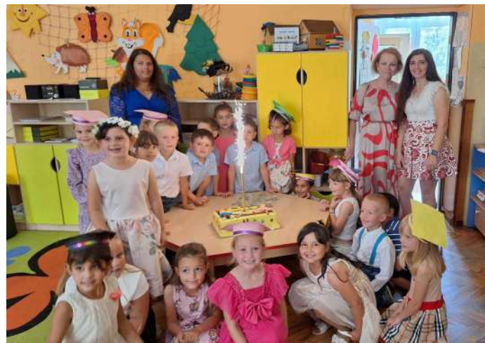
Rozlúčka s predškolákmi

V apríli sme naše hranie a učenie venovali ochrane prírody. Pani učiteľky pripravili environmentálne dopoludnie „Deň Zeme – chráňme si planétu“. Deti sme zážitkovým učením a praktickou činnosťou učili separovať odpad, hrali sme sa rôzne hry s environmentálnou tematikou. V rámci tejto témy sme pozvali medzi nás aj pracovníkov Lesnej správy v Betliari pod patronátom Lesy s.r.o., ktorí sa venovali deťom a formou lesnej pedagogiky poskytli deťom rôzne poznatky zo života lesného spoločenstva. Tento mesiac prišli do našej materskej školy aj študenti zo Strednej zdravotnej školy v Rožňave a ukázali deťom praktické ukážky poskytovania prvej pomoci. Deti si mohli vyskúšať obväzovanie a ošetrovanie drobných rán a zlomenín, prvú pomoc pri dusení, či krvácaní z nosa. V apríli sa v základnej škole konal zápis do 1. Ročníka. Keďže aj naši predškoláci sa už na školu veľmi tešia, pripravili si krátky kultúrny pozdrav a pozdravili v rámci zápisu do 1. Ročníka svojich kamarátov a budúce pani učiteľky.