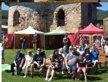
Štítnické hradné hry