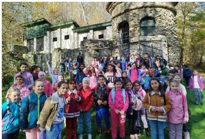
1. stupeň - výlet v Betliari

Keďže sme škola pre všetkých, svoje miesto v rámci podporných opatrení má aj školský podporný tím, ktorý tvoria 10 pedagogickí asistenti a sociálny pedagóg. Pedagogickí asistenti sa venujú žiakom so zdravotným znevýhodnením a v rámci viacerých aktivít sa venovali rozvoju grafomotoriky, jemnej a hrubej motoriky, pamäti, zmyslovému vnímaniu a učebným štýlom. Sociálno-pedagogická intervencia realizovaná školským podporným tímom bola zameraná na rozvoj empatie, prosociálne správanie, podporu spolupráce, kreativity a wellbeing v školskom prostredí. Sociálna pedagogička pracuje s našimi žiakmi a rozvíja ich sociálne zručnosti v rámci programu Buddy a ranných kruhov. V 1. ročníku sme využili metódu dobrého štartu na úspešnú adaptáciu žiakov na školské prostredie.