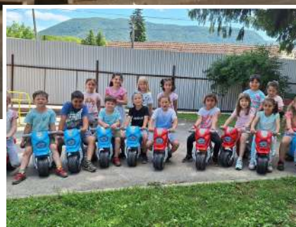
Zo života materskej školy na str. 6