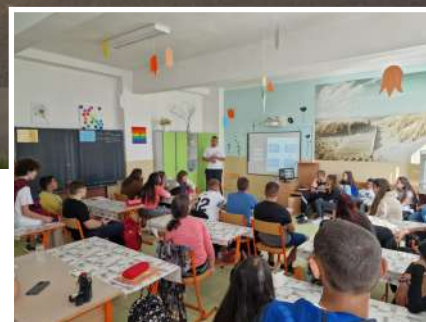
Život v našej škole na str. 8