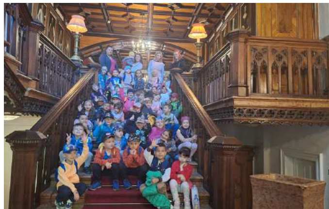
Výlet v kaštieli Betiar

V septembri bola činnosť materskej školy zameraná hlavne na adaptáciu novoprijatých detí. Naším cieľom bolo, aby sa nové detičky cítili u nás dobre, aby sa im