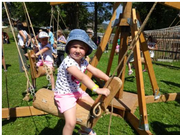
Drevený kolotoč na fyzický ľudský pohon bol kedysi súčasťou tradičných hier pre deti

„Projekt bol spolufinancovaný Košickým samosprávnym krajom z programu Terra Incognita vo výške 5000,- €.“