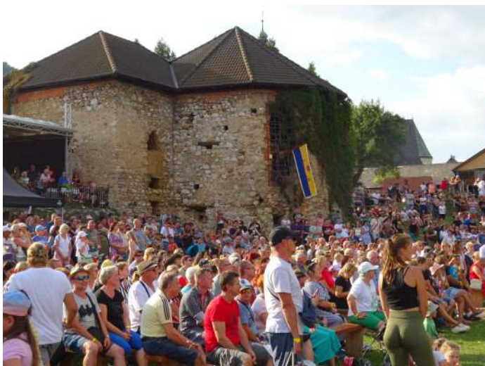
Podujatie navštívil tento rok rekordný počet návštevníkov

O zábavu nebola núdza ani počas kaukliarskych predstavení, kde svoju prácu s dravcami a fascinujúce sokoliarske schopnosti a znalosti, ako aj prelety vtákov predstavil BIATEC.