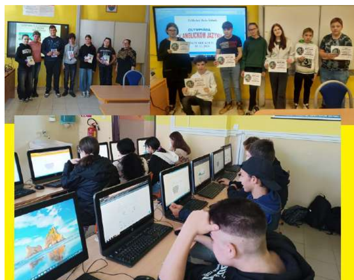
Olympiády a i-Bobor

Pre žiakov pripravujeme ešte, filmové predstavenie v Košiciach, návštevu Hvezdárne v Rožňave, divadelné