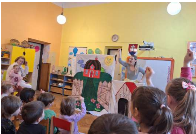
Divadelné predstavenie "Myška Eliška"