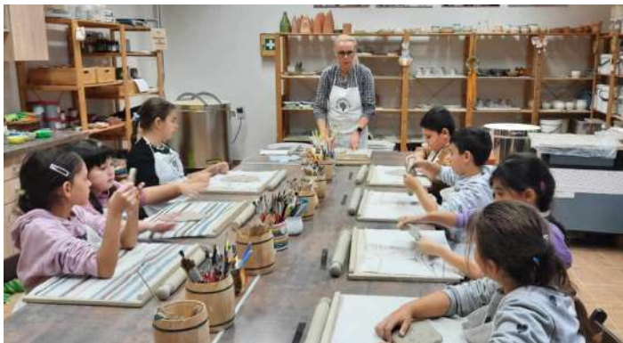
Tvorivé dielne - GOS Rožňava

Žiaci 8. a 9. ročníka absolvovali prednášky z cyklu Iná cesta realizovaného v spolupráci s GemArtom zamerané na možnosti cestovania a spoznávania rôznych kultúr. Počas Európskeho týždňa športu od 23. septembra do 30. septembra sme sa zapojili do projektu #Beactive