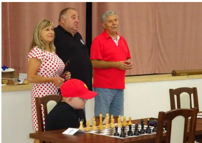
Otvorenie šachového turnaja Memoriál Ladislava Kozáka a Jána Rogosa

Šachový oddiel ŠK Baník Štítnik v roku 2023/2024 pokračoval v súťaži 3. ligy skupiny D3 košického kraja. V tejto skupine štartovalo osem družstiev. Naše družstvo získalo počas súťaže 4 body a skončilo na siedmom mieste.